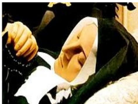
Nevers – Bernadette Soubirous