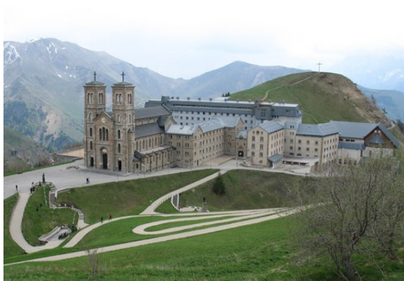
Santuario de La Salette