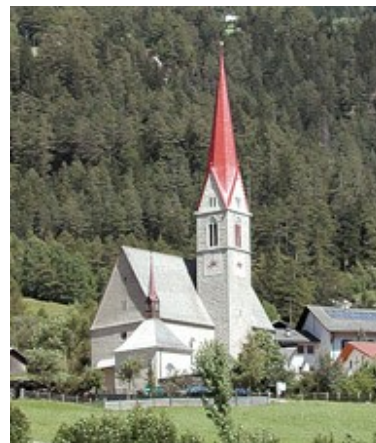
Santuario Campo di Trens (BZ)