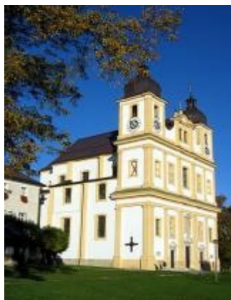
Santuario Maria Plain (Salisburgo)