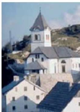
Santuario Maria Saal (Klagenfurt)