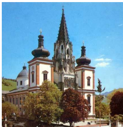
Santuario Mariazell (Stiria - Austria)